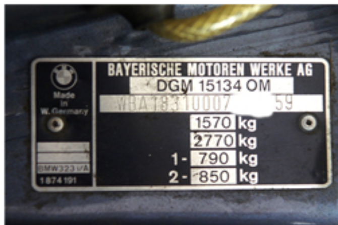
TARGHETTA IDENTIFICATIVA (ADESIVA O RIVETTATA)