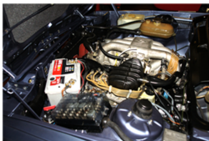
VANO MOTORE PULITO