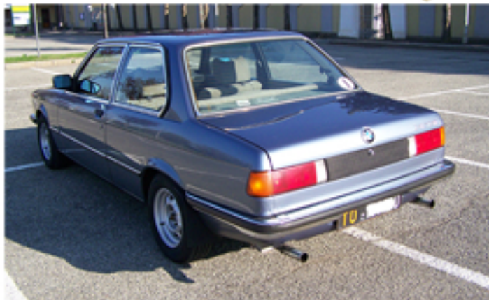
3/4 POSTERIORE LATO SINISTRO