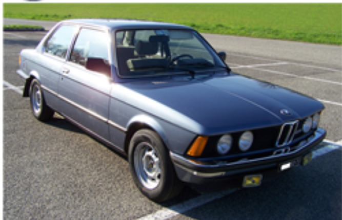
3/4 ANTERIORE LATO DESTRO