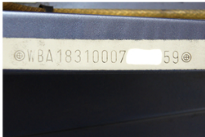
PUNZONATURA NUMERO DI TELAIO