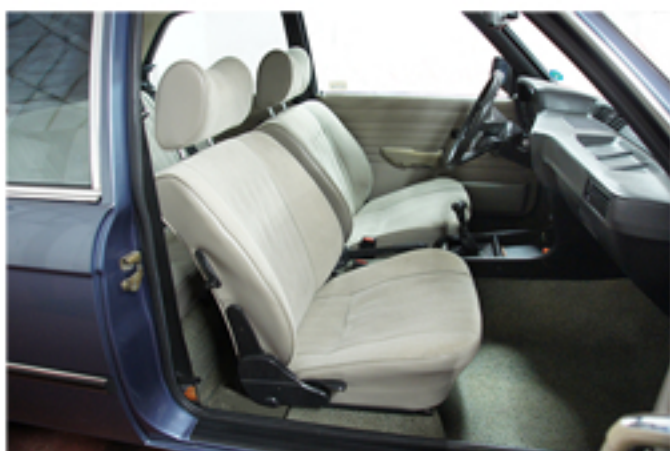
INTERNO SENZA TAPPETI E SENZA FODERINE SEDILI